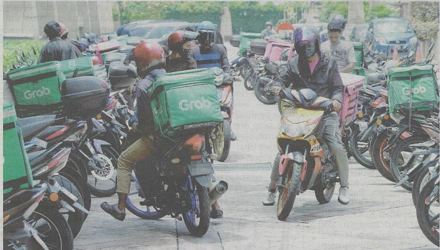
BILANGAN pekerja dalam sektor ekonomi gig dilaporkan semakin bertambah dan melebihi permintaan, sekali gus menjejaskan pendapatan mereka. - GAMBAR HIASAN

"Persaingan seperti ini menyebabkan industri ekonomi gig menjadi kucar-kacir dan tidak mendatangkan manfaat kepada pekerja secara keseluruhan.